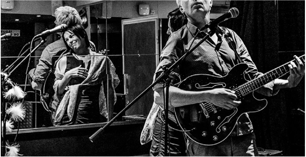
FIL / Casino Partouche Arcachon 2017