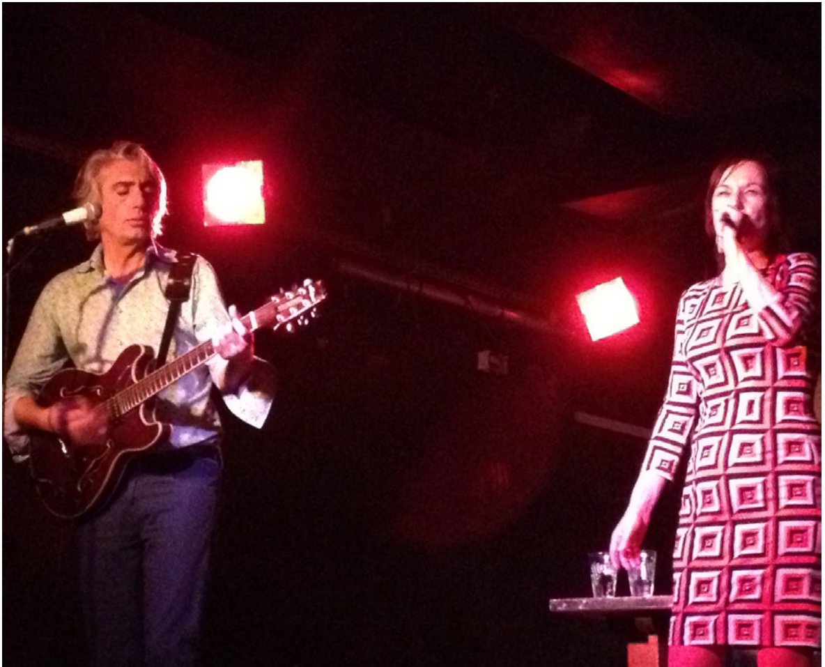
FIL / Comptoir du Jazz Bordeaux 2013